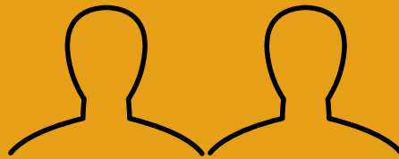
Personnes-ressources du département de l'éducation népalais

Le conseil d'administration de l'école est composé des huit membres mentionnés ci-dessus