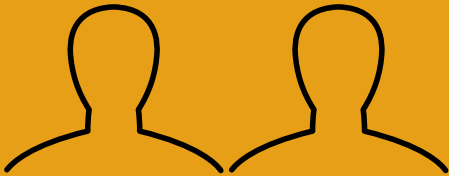
Représentants des parents