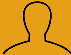
Représentant des enseignants