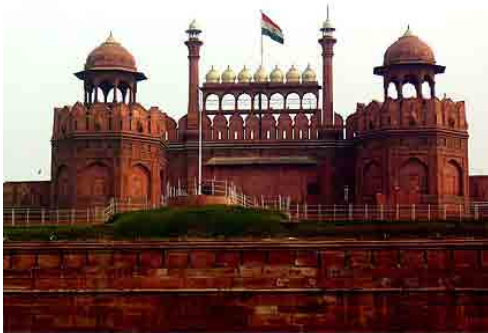
Le Fort Rouge